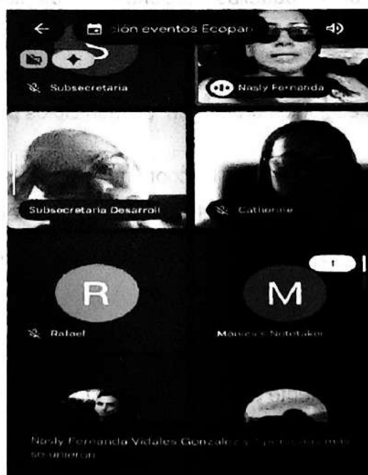
(Reunión de seguimiento y planeación EQUIPO ECOPARQUE DE LA SALUD)