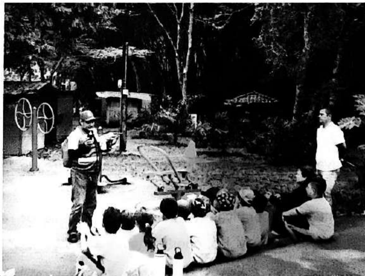
(Pedagogía ambiental LEY 2232 DEL 2022, ECOPARQUE DE LA SALUD, marco de la ordenanza 633 del 2023)

De igual manera, mantuve procesos de articulación y coordinación con el operador Recreavalle, orientados a alinear acciones institucionales relacionadas con la gestión ambiental, la educación ambiental y la implementación de actividades contempladas dentro del Plan de Conservación del Ecoparque. Esta articulación permitió avanzar en la generación de sinergias institucionales que contribuyen a la sostenibilidad de las acciones desarrolladas en el territorio.